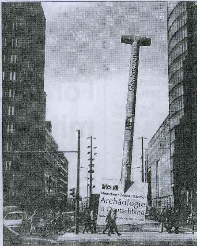
So wird der Riesenspaten auf dem Potsdamer Platz aussehen. Die Fotomontage erlaubt den Blick in die Zukunft. Aufgebaut wird der Idealspaten am kommenden Dienstag.

Dies hat auch das Dortmunder Unternehmen bild-werk erkannt und die Herdecker Firma Idealspaten als Sponsor für diese werbewirksame Aktion gewinnen können. Idealspaten ist seit über 100 Jahren in Herdecke ansässig und verkauft jährlich u.a. eine Million Schaufeln und etwa 400 000 Spaten. Das Produkt Idealspa-