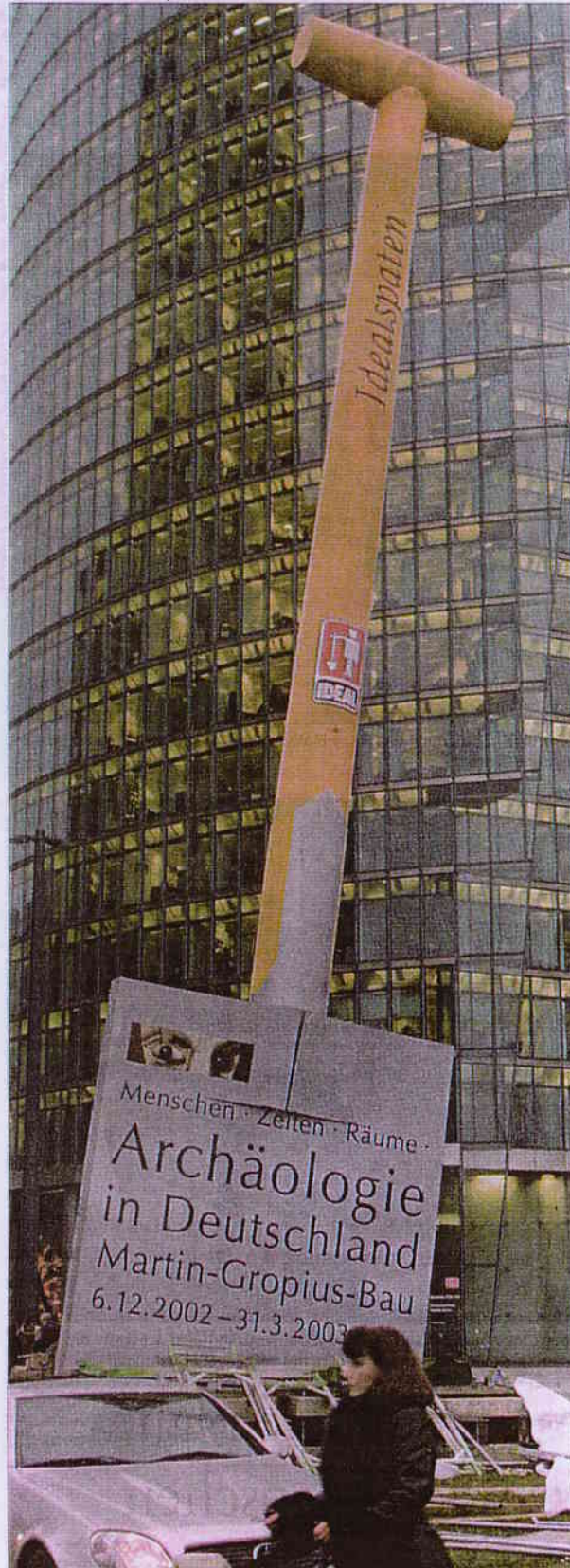
Der Spaten am Potsdamer Platz macht auf die Ausstellung „Menschen, Zeiten, Räume – Archäologie in Deutschland“ aufmerksam

Unter dem Motto „Menschen, Zeiten, Räume – Archäologie in Deutschland“ zeigen Altertumswissenschaftler aus dem gesamten Bundesgebiet wichtige Funde, die in den vergangenen 25 Jahren freigelegt worden sind. Wichtig deshalb, weil sie den Kulturexperten neue Erkenntnisse brachten. Zahlreiche Ausgrabungsstücke haben dazu geführt, dass die Archäologen ihre Vorstellungen über das Leben in vergangenen Jahrhunderten teilweise revidieren mussten. Die Ausstellung ist bis zum 31. März 2003 zu sehen. rit