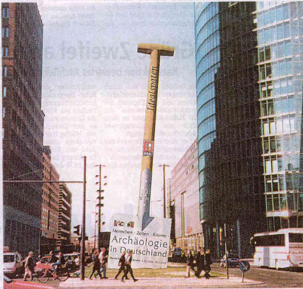
So soll er sich präsentieren, der Riesenspaten auf dem Potsdamer Platz in Berlin.

Die Agentur bild-werk hat die Idee für diesen außergewöhnlichen Werbeauftritt entwickelt. Die Firma Weise setzt im Auftrag von bild-werk das Bauvorhaben um. Finanziert wird das Ganze vom Sponsor Idealspaten Bredt aus Herdecke.