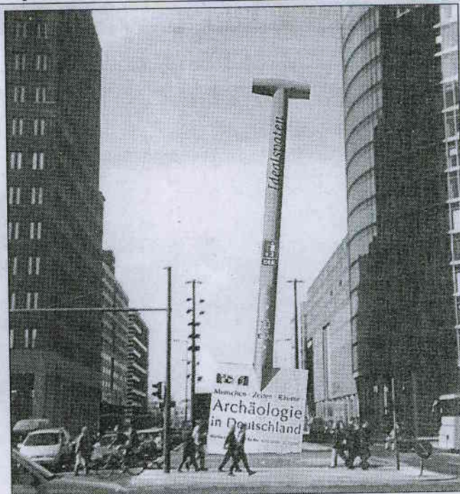
Ein seltsames Bild: Mitten auf dem Potsdamer Platz wird der 20 Meter hohe Spaten für vier Monate stehen. (WR-Montage)

Die seit über 100 Jahren in Herdecke ansässige Firma tritt übrigens auch als Mit-Sponsor der archäologischen Berliner Ausstellung auf. Der Ideal-Spaten hat neben seiner gigantischen Höhe übrigens noch weitere überdimensionale Abmessungen vorzuweisen: Er ist fünf Meter breit und der Stieldurchmesser beträgt einen stolzen Meter.