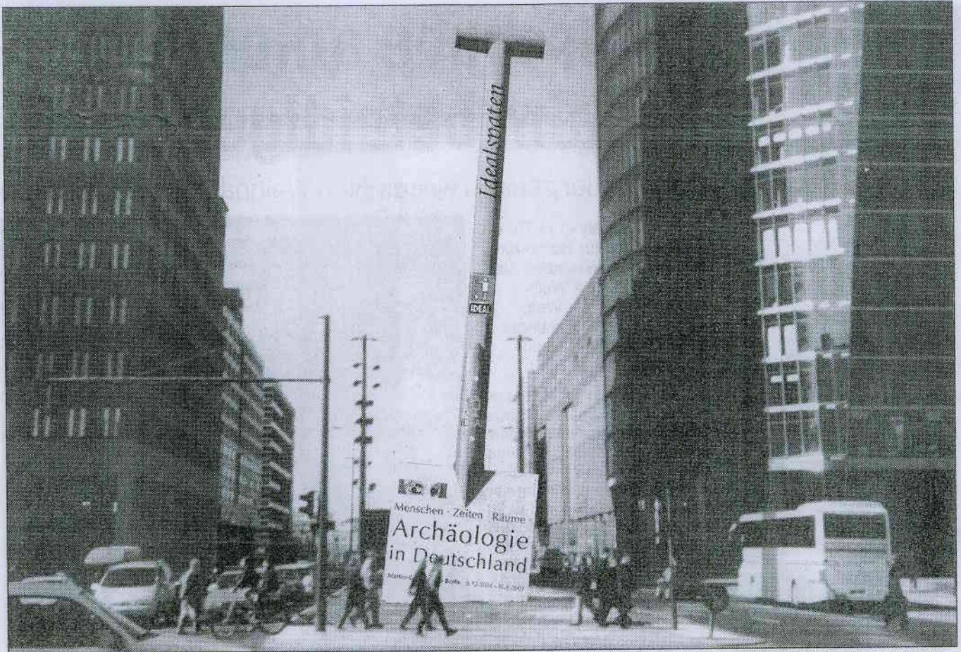
Dort, wo einst die Mauer stand, wird der Riesenspaten installiert. Der Stiel des Spatens ist in einem Stück gefertigt. Der Sand auf dem Boden verdeckt die Betonplatten, die das „Bauwerk“ halten. Montage: bild-werk