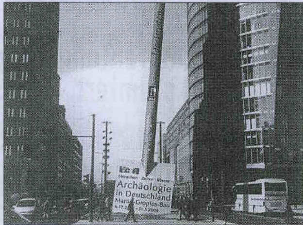
Riesen-Spaten: Werbung für Archäologie-Ausstellung.

Das Einfache ist meist das, was am ehesten überzeugt: Um auf eine Archäologie-Ausstellung in Berlin aufmerksam zu machen, entwickelte die Dortmunder Agentur „bild-werk“ die Idee, einen riesigen Spaten in den Potsdamer Platz zu rammen. Im unweit entfernten Gropius-Bau geht es von Anfang Dezember bis Ende März um „die wichtigsten Ausgrabungen der letzten 25 Jahre“.