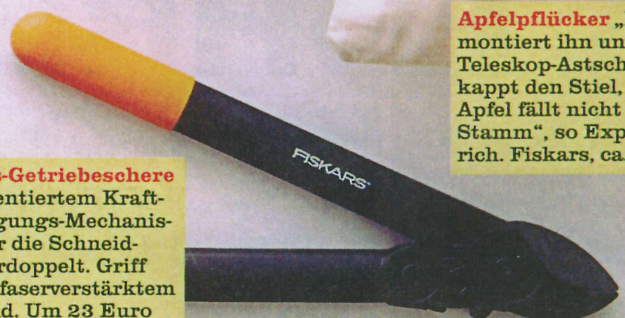
Amboss-Getriebeschere Mit patentiertem Kraftübertragungs-Mechanismus, der die Schneidkraft verdoppelt. Griff aus glasfaserverstärktem Polyamid. Um 23 Euro