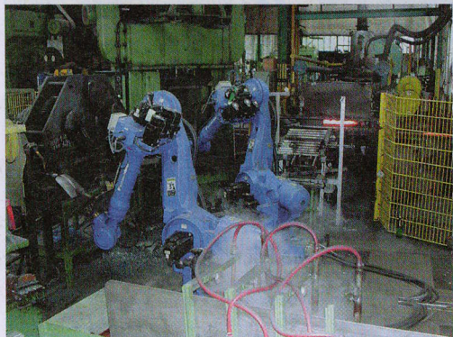
In der Schaufelfertigung übernehmen Roboter die Arbeit an den heißen und anstrengenden Arbeitsplätzen

Zum Kleingartenwesen hat IDEALSPATEN eine enge Beziehung, denn es gibt kaum einen Garten, in dem nicht schon einmal Gerätschaften der Herdecker Firma eingesetzt worden ist. Langlebigkeit und Qualität der Werkzeuge von IDEALSPATEN stehen im Gegensatz zu den vielen Erzeugnissen der modernen „Wegwerfgesellschaft“.